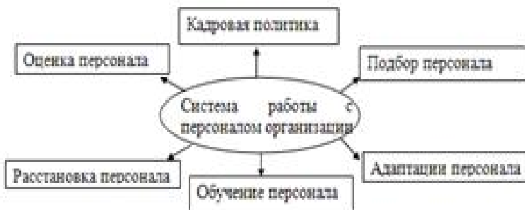
Рисунок 2 – Система работы с кадрами [8, с. 15]

Если рисунок взят из первичного источника без авторской переработки, следует сделать ссылку, например: