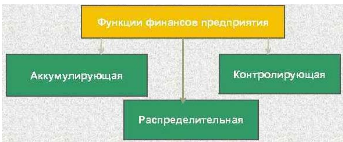
Рисунок 1 – Функции финансов предприятия

Рисунки, за исключением рисунков в приложениях, следует нумеровать арабскими цифрами сквозной нумерацией по всей работе. Каждый рисунок (схема, график, диаграмма) обозначается словом «Рисунок», должен иметь заголовок и подписываться следующим образом – посередине строки без абзацного отступа, например: