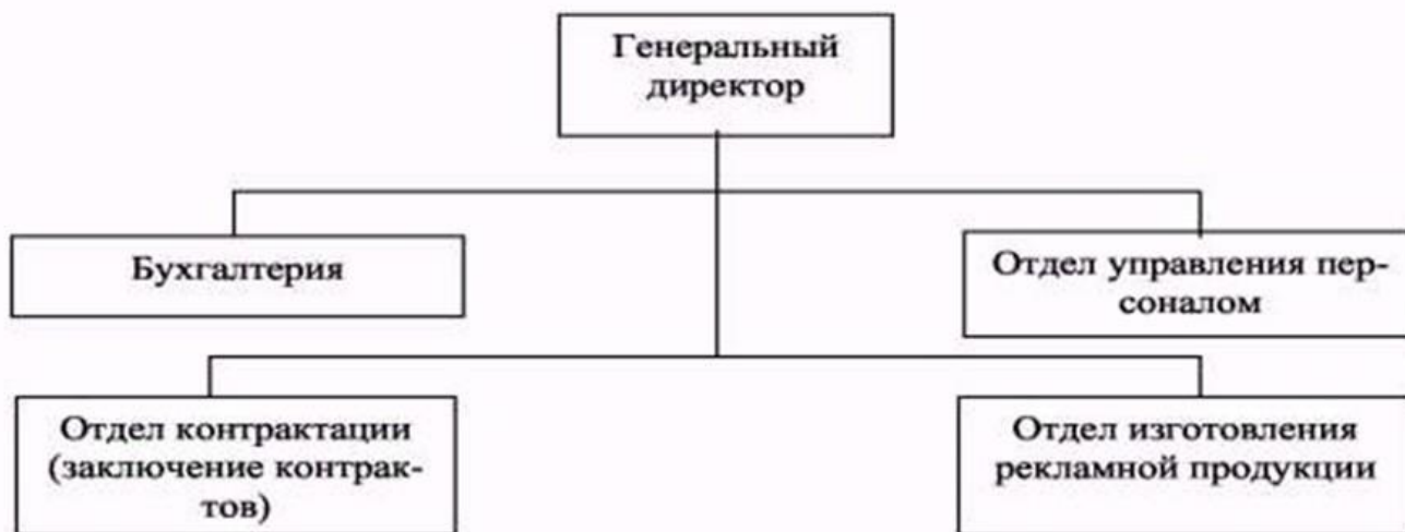
Рис. 1. Схема организационной структуры фирмы

Исходные данные: Рекламно-посредническая фирма (РПФ) работает на рынке нововведений второй год. Это - самостоятельная коммерческая структура, занимающаяся изготовлением рекламных роликов, демонстрационных комплексов и тренажеров по заказу организаций и использующая их для рекламы товаров заказчиков, а также предоставляющая покупателям дополнительные услуги в виде «сопровождения» проданного оборудования, технологий. Свою деятельность РПФ осуществляет на основе прямых договоров с заказчиками. Численность персонала на начальный период работы фирмы 41 человек. Схема организационной структуры фирмы приведена на рисунке: