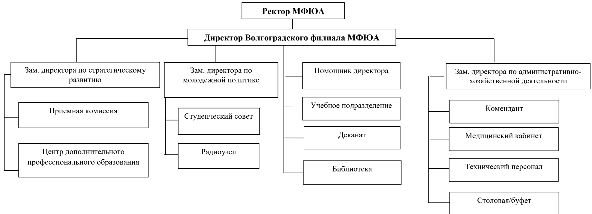
Рис. 1. Обобщенная схема системы управления Волгоградского филиала МФЮА

(отдел кадров, бухгалтерия и архив находятся в головном вузе)