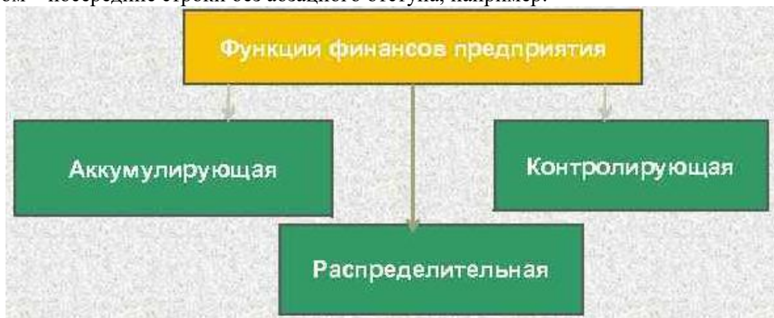
Рисунок 1 – Функции финансов предприятия

Рисунки, за исключением рисунков в приложениях, следует нумеровать арабскими цифрами сквозной нумерацией по всей работе. Каждый рисунок (схема, график, диаграмма) обозначается словом «Рисунок», должен иметь заголовок и подписываться следующим образом – посередине строки без абзацного отступа, например: