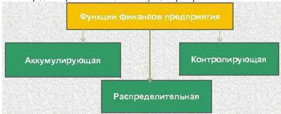
Рисунок 1 – Функции финансов предприятия

Рисунки, за исключением рисунков в приложениях, следует нумеровать арабскими цифрами сквозной нумерацией по всей работе. Каждый рисунок (схема, график, диаграмма) обозначается словом «Рисунок», должен иметь заголовок и подписываться следующим образом – посередине строки без абзацного отступа, например: