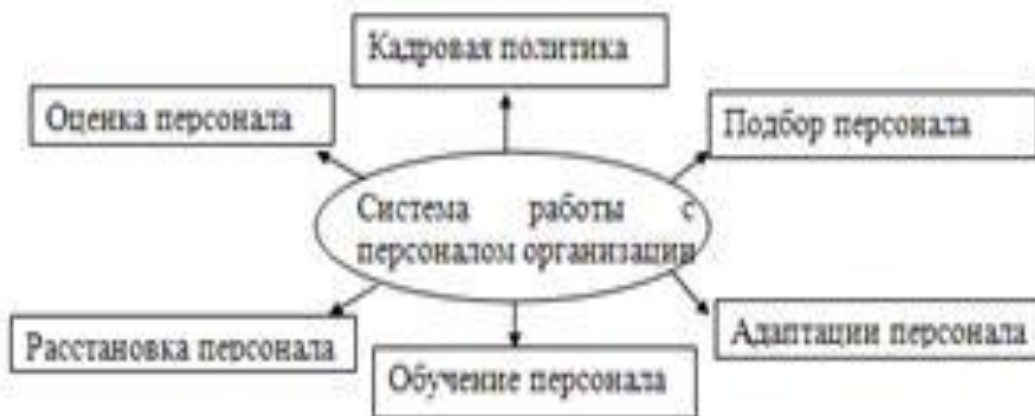
Рисунок 2 – Система работы с кадрами [8, с. 15]

Если рисунок взят из первичного источника без авторской переработки, следует сделать ссылку, например: